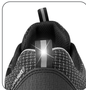
reflexní doplňky reflexné doplnky reflective accessories elementy odbłaskowe