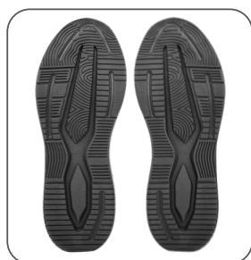
podešev podošva outsole podeszwa