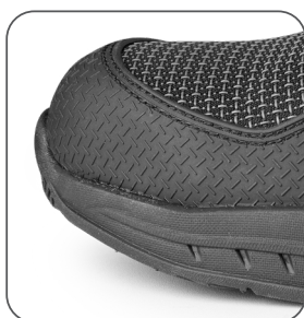
zesílená přední část proti okopu vonkajšia ochrana špičky reinforced TPU overcap nosek z TPU wzmocnieniem