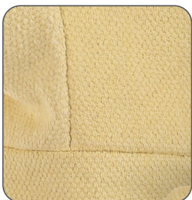
aramidová tkanina aramid cloth włóknina aramidowa